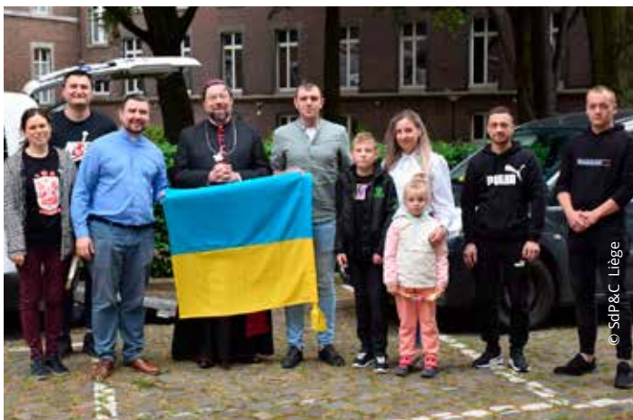
Bénédictio des véhicules utilitaires pour l'Ukraine.

Dans le cadre de l'action sociale et solidaire envers la communauté ukrainienne lancée à la suite du début de l'invasion russe, en février dernier, la Pastorale des Migrants et Caritas Secours Liège convient les personnes réfugiées et celles et ceux qui les ont aidées à se retrouver autour d'un repas belgo-ukrainien le 18 novembre prochain à l'Espace Prémontrés à Liège.