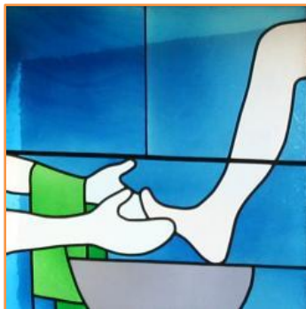
Le lavement des pieds, vitrail de Max Ruedi au couvent dominicain d'Ilanz (Suisse)

Afin de laisser à notre Évêque et à son équipe le temps de discerner de l'opportunité de l'entrée en pré-cheminement, il est demandé à la personne de se présenter autant que possible avant la fin du mois de mai .