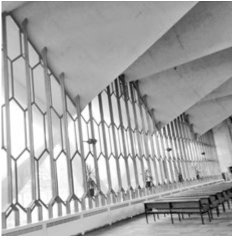
Architecture en drapeaux, église Saints-Pierre-et-Paul, Droixhe

En conformité avec « Objectif 2020 » et suivant des demandes déjà antérieures, il est recommandé aux fabriques d'une même commune de se réunir toutes au moins deux fois par an. L'initiative de cette réunion peut venir soit du curé soit d'un ou deux membres de fabriques soucieux d'établir des contacts entre eux. Le vicaire épiscopal ou une autre personne du service du temporel peut assister à certaines réunions. L'échevin des cultes pourra être invité lors de la mise en commun de demandes ou lors de la réunion de synthèse du projet.