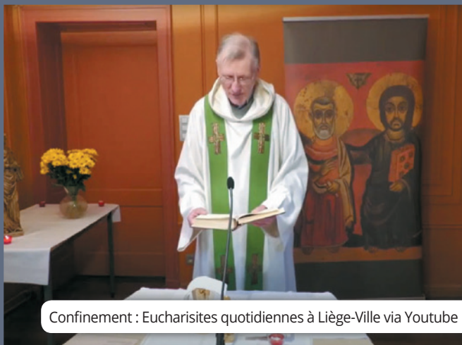
Confinement : Eucharistiques quotidiennes à Liège-Ville via Youtube