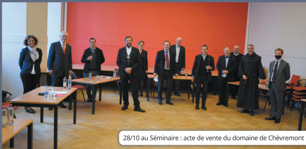
28/10 au Séminaire : acte de vente du domaine de Chèvremont