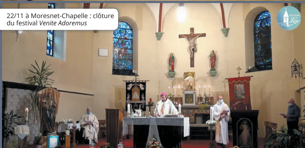
22/11 à Moresnet-Chapelle : clôture du festival Venite Adoremus