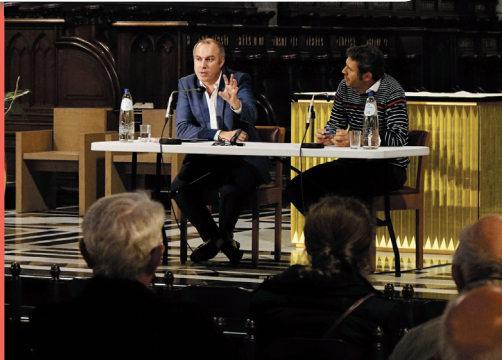
14/10 : Conférence « De la COP21 à la COP26 » par François Gemenne à la cathédrale Saint-Paul