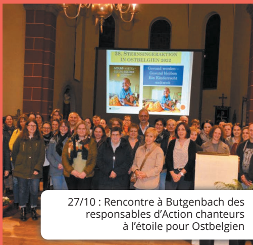
27/10 : Rencontre à Butgenbach des responsables d'Action chanteurs à l'étoile pour Ostbelgien