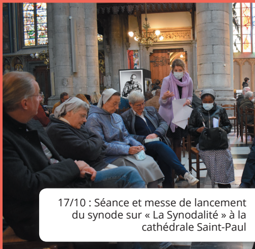
17/10 : Séance et messe de lancement du synode sur « La Synodalité » à la cathédrale Saint-Paul