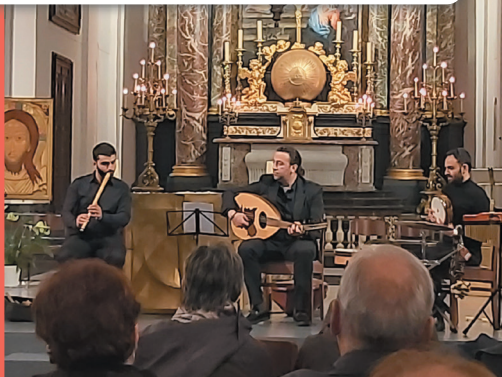
21/10 : Concert interculturel « Exode vers l'autre » à la Collégiale Saint-Barthélemy