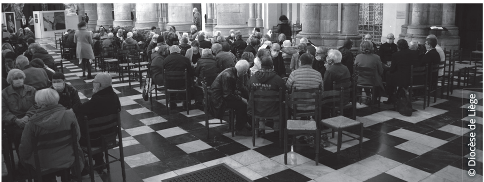
Lancement du Synode sur la Synodalité le 17 octobre 2021

L'Épiphanie, fêtée ce 2 janvier, nous montre ainsi des pas parcourus : « des mages venus d'Orient arrivèrent à Jérusalem et demandèrent : “Où est le roi des Juifs qui vient de naître ? Nous avons vu son étoile à l'orient et nous sommes venus nous prosterner devant lui” . » Les mages sont des gens qui se mettent en marche et qui suivent une étoile. « Quand ils virent l'étoile, ils se réjouirent d'une très grande joie. Ils entrèrent dans la maison, ils virent l'enfant avec Marie