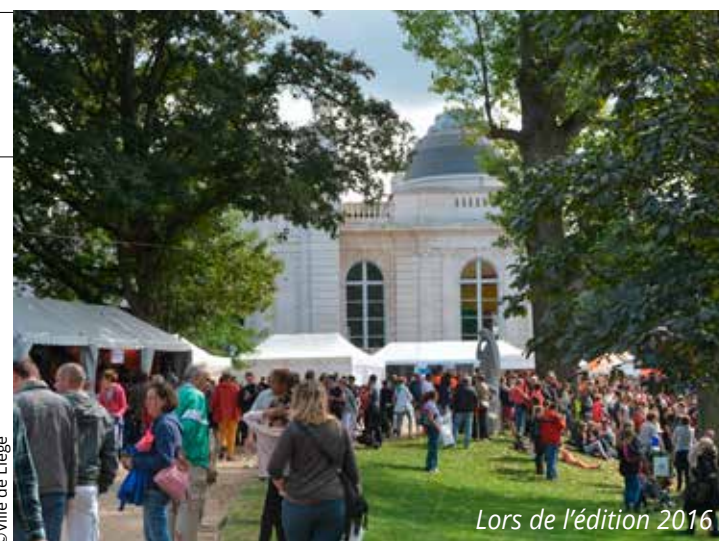
Lors de l'édition 2016

Cette année, Retrouvailles fête sa 27e édition! Belle maturité pour cet événement qui n'a pas pris une ride... Pour les 80 premières associations participantes en 1992, il leur semble que c'était hier, et pourtant, cela fait déjà plus d'un quart de siècle que le monde associatif liégeois s'y presse le temps d'un week-end (30 à 35.000 visiteurs!), et pas n'importe lequel, puisque c'est celui de la rentrée après les vacances... Retrouvailles accueille aujourd'hui quelques 300 associations regroupées sous quatre axes d'activité: Art & Culture; Sports & Jeux; Vie associative & Solidarité; Nature environnement. Venez découvrir les communautés catholiques de Liège. Les bénévoles de nos paroisses et de nos communautés catholiques vous accueilleront avec plaisir pour répondre à toutes vos questions: questions sur la foi; formation chrétienne pour enfants, adolescents, jeunes, adultes; groupes de prière; horaires de messes; solidarité; baptême, mariage, funérailles. Mais aussi pour accueillir vos idées, vos projets, vos propositions de service... Un coin et une animation enfants sont prévus. RCF-Liège (Radio chrétienne francophone, 93.8 FM) sera également présente pour plusieurs heures d'animation en direct, avec un stand qui lui sera spécialement dédié. Autre stand: le circuit des collégiales. Il vous permettra de vous mettre en