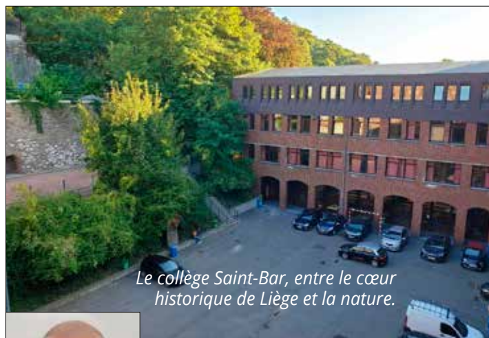
Le collège Saint-Bar, entre le cœur historique de Liège et la nature.

Le collège Saint-Barthélemy de Liège est marqué par l'esprit lassalien, la mixité sociale et la philosophie d'Emmanuel Mounier, dans cette notion d'égalité de tout être humain et de toute personne qui est unique. L'intelligence de l'esprit se mue ici en intelligence du cœur.