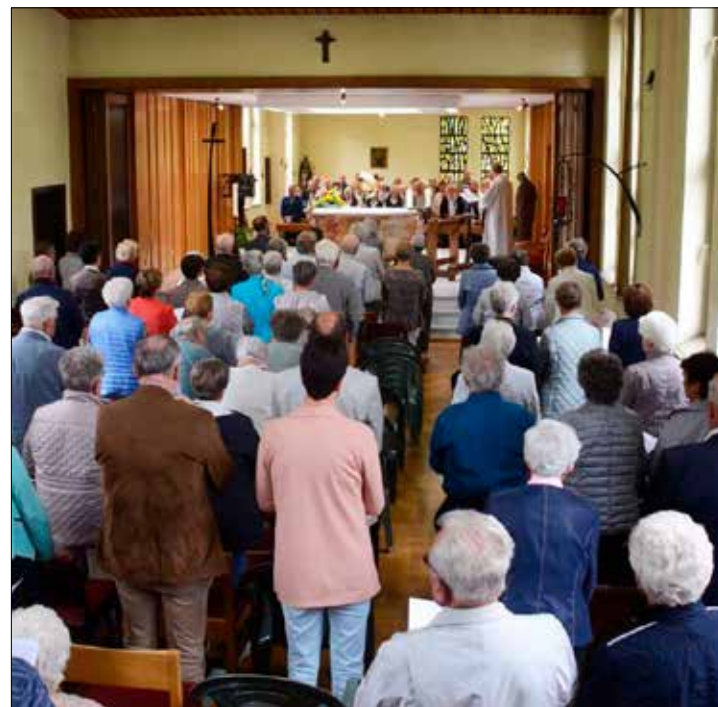
La dernière fête du Carmel le 14 juin 2019 dans la chapelle.