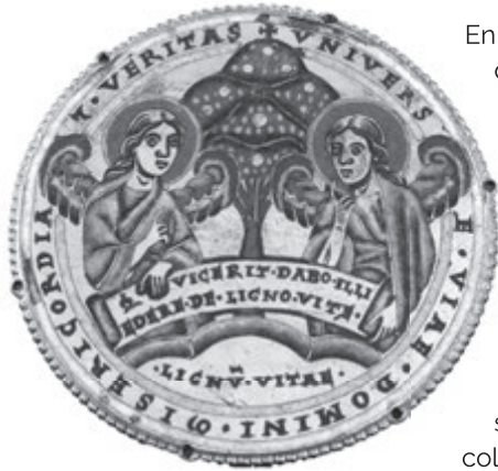
Médaille Arbre de la Vie

En cherchant enfin ce que signifie « l'arbre de vie », je découvre qu'il est d'abord le centre du paradis terrestre selon la Genèse, mais que personne n'a pu profiter de ses fruits, car le paradis fut fermé et gardé par des chérubins (Gn 3,24). Cependant quand le Christ a donné sa vie et est mort sur la croix, celle-ci est devenue le nouvel arbre de vie, qui nous donne la vie en plénitude. Comme l'écrit Rupert, dans son commentaire sur l'Apocalypse ( Patrologia latina , t. 169, col. 879): « Cet arbre de vie, qui est le Christ, nous restaure par son corps et son sang; et déjà maintenant il ressuscite notre âme de la mort du péché, et il ressuscitera notre chair au dernier jour ». La