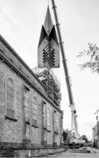
Ferrières – pose du nouveau clocher le 4 octobre 2017