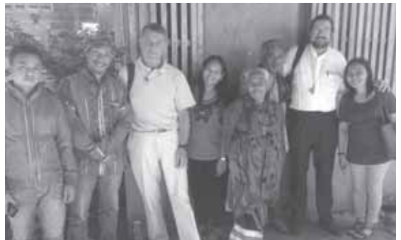
Mgr Delville avec les indigènes devant une maison locale à Cotabato

Nous avons aussi visité les projets d'agriculture écologique,