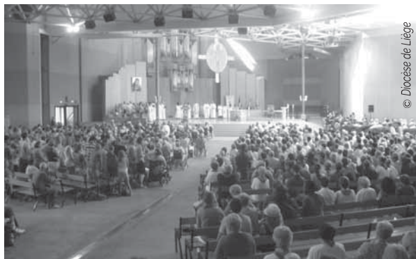
Messe d'envoi à Lourdes

faite sur base d'engrais organiques ; ces projets, soutenus par Entraide et Fraternité, sont promus sur place par des fermes modèles et des agriculteurs motivés. Les organisations populaires promeuvent en outre la réforme agraire et permettent aux cultivateurs de posséder leur terre.