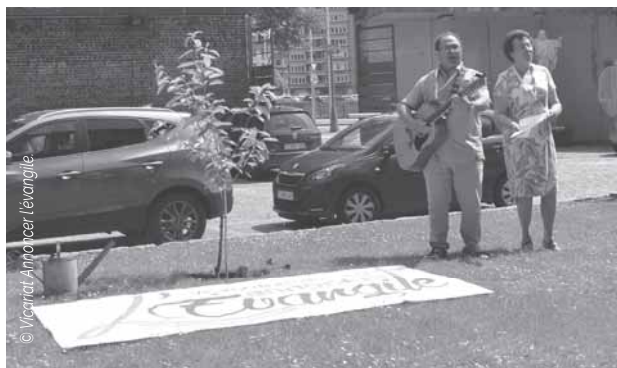
Plantation d'un arbre dans la cour de l'Espace Prémontrés lors de la matinée de mise en oeuvre des pistes d'action pour une catéchèse renouvelée le 26 mai 2018

Dieu sait si l'on a dit et redit que l'année 2017-2018 aura été une année décisive pour la catéchèse : consultation, assises, promulgation Mais tout cela serait vain si l'élan impulsé ne trouvait maintenant sa concrétisation. Il importe donc de « battre le fer tant qu'il est chaud » et de ne laisser retomber ni l'enthousiasme ni la volonté de bien faire.