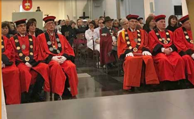
25/11 à Saint-Barthélemy à Liège: messe des mangons.