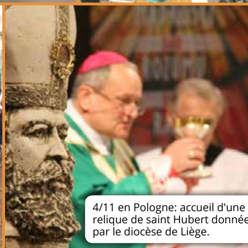
4/11 en Pologne: accueil d'une relique de saint Hubert donnée par le diocèse de Liège.