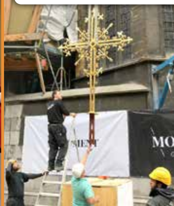
11/10 à la cathédrale: installation de la croix rénovée.