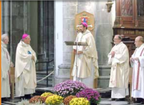
11/11 à la cathédrale: messe de l'armistice en présence de Mgr Heinrich Mussinghoff, évêque émérite d'Aix-la-Chapelle.