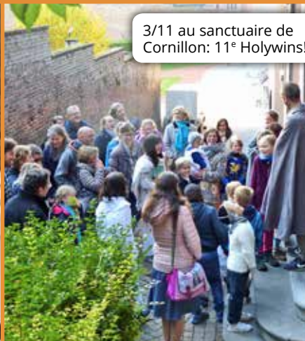
3/11 au sanctuaire de Cornillon: 11 e Holywins!