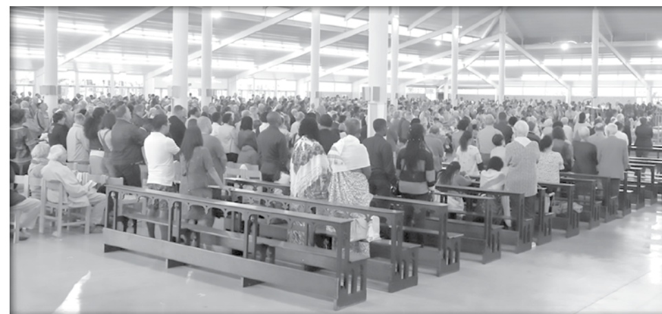
Fête de l'Assomption au sanctuaire de Banneux

Vous pouvez consulter et télécharger le rapport sur le site www.rapportanneleglise.be . Il est aussi disponible dans les librairies liturgiques, dont Siloë (40 rue des Prémontrés à Liège).