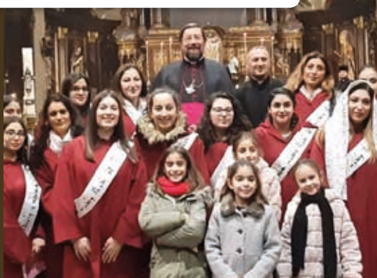
25/1 à Herstal: célébration œcuménique - Mgr Delville entouré des diaconesses de la communauté orthodoxe syrienne.