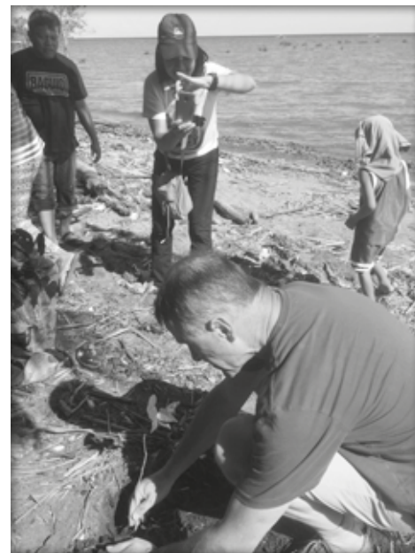
Plantation d'un arbre pour renforcer les dunes à Lala

Comme dit l'évangile de Luc en ce début de carême: « Jésus, rempli d'Esprit Saint, quitta les bords du Jourdain; dans l'Esprit, il fut conduit à travers le désert » (Lc 4, 1). L'Esprit nous conduit en des zones inconnues et il nous invite à découvrir Dieu autrement. À notre tour, laissons-nous conduire par l'Esprit, le souffle de Dieu, et sachons découvrir la face cachée des choses. Comme Jésus tenté au désert, résistons à la tentation de tout faire par nous-mêmes, et mettons notre confiance en Dieu, en l'inouï de sa pa-