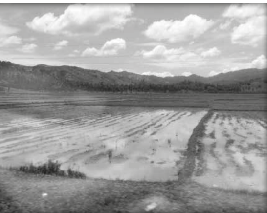
Reisplantage auf Mindanao

Auf der Insel Jolo wurden am 27. Januar 2019 bei einem Selbstmordanschlag 27 Menschen in der Kathedrale Unsere Liebe Frau vom Berg Karmel getötet. Und am 30. Januar wurde ein Granatenangriff auf die Zamboanga-Moschee südwestlich der Insel Mindanao verübt und forderte zwei muslimische Opfer. So wurden Märtyrer beider Religionen zu Opfern der Gewalt, die inmitten von Friedensstiftern entfesselt wurde. Die Märtyrer des 21. Jahrhunderts fordern uns zu Beginn der Fastenzeit in unserem Glauben heraus. Sie zeigen uns das konkrete Engagement der Gläubigen und die Intensität ihres Glaubens.