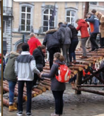
27/1 à Bruxelles: traversée d'un pont en clôture de la nuit solidaire.