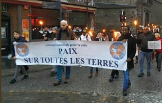
1/1 dans les rues de Liège: marche pour la paix organisée par Sant'Egidio.