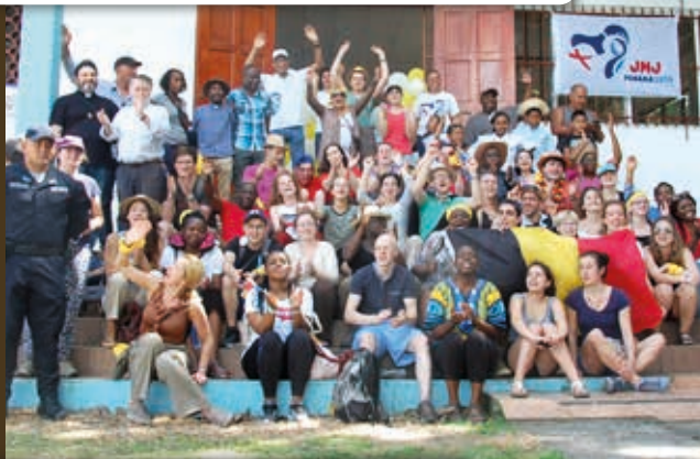
22-27/1 au Panama: les JMJ - une photo des Belges!