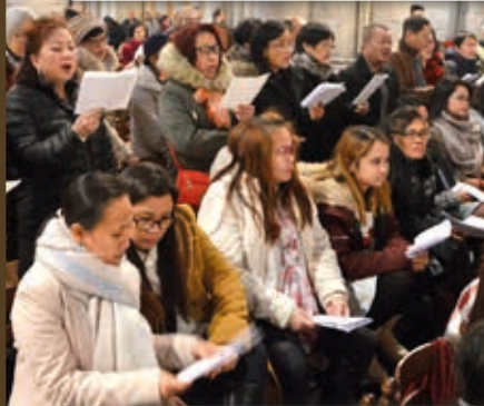
13/1 à la cathédrale: fête du baptême du Seigneur avec les communautés d'origine étrangère.