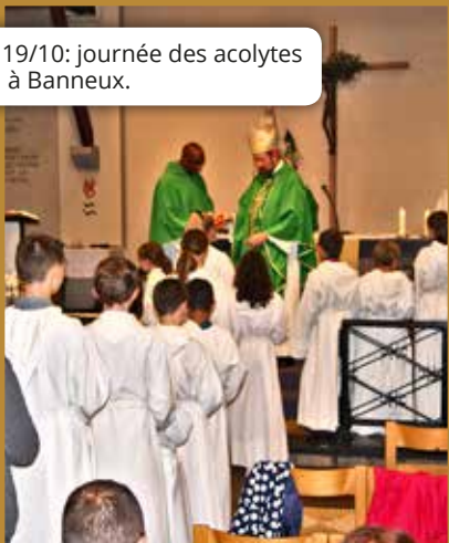
19/10: journée des acolytes à Banneux.