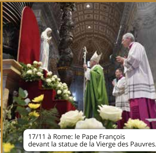
17/11 à Rome: le Pape François devant la statue de la Vierge des Pauvres.