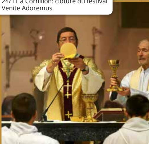
24/11 à Cornillon: clôture du festival Venite Adoremus.