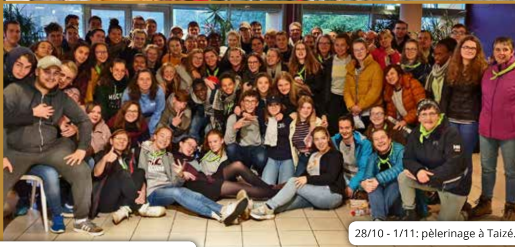
28/10 - 1/11: pèlerinage à Taizé.